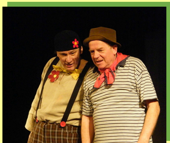
Jízlivý glosátor Dvojprogram Sobota 7. května 19:30