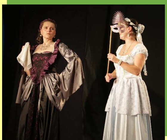
Žena v trysku století Čtvrtek 5. května 19:30