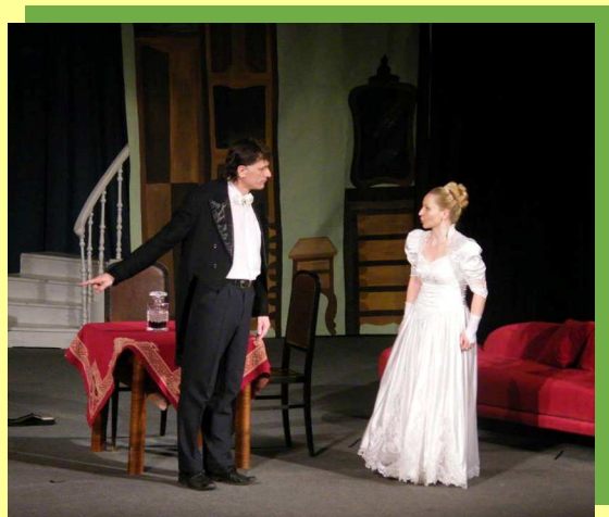
My Fair Lady Neděle 8. května 15:00 a 18:00